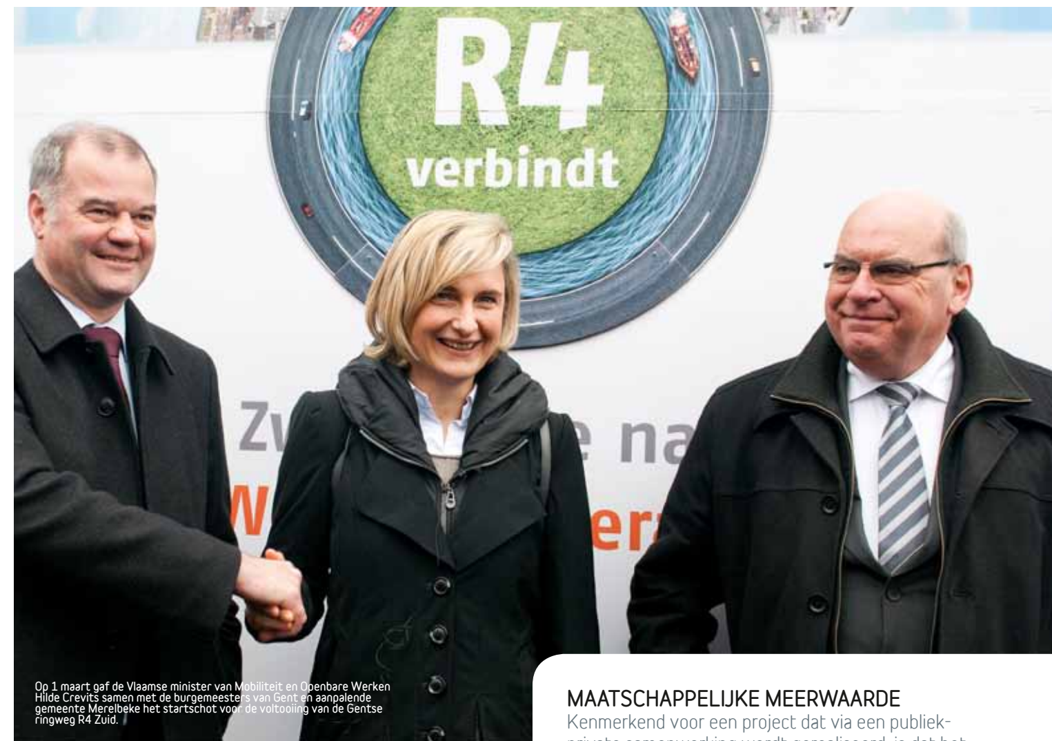
Op 1 maart gaf de Vlaamse minister van Mobiliteit en Openbare Werken Hilde Crevits samen met de burgemeesters van Gent en aanpalende gemeente Merelbeke het startschot voor de voltooiing van de Gentse ringweg R4 Zuid.

Het eerste grote infrastructuurwerk was de bouw van een nieuwe viaduct om de regio ten noorden van de luchthaven van Zaventem te ontsluiten. Deze werd op 13 maart geopend door de Vlaamse minister. Twee andere werken, namelijk de aanleg van een noord-zuidverbinding in de Kempen en de voltooiing van de Gentse ringweg, zijn in uitvoering. De laatste drie zijn in voorbereiding: de aanleg van een noord-zuidverbinding in Limburg, die van de ringweg N60 rond Ronse en de omvorming van de havenrandweg Zuid (A11) naar Zeebrugge. Er is dus nog veel werk aan de winkel!