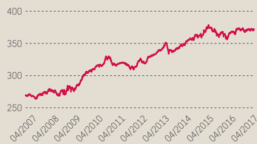
Jaarlijks rendement over de voorbije 10 kalenderjaren (31-12) (vóór kosten en taken) in EUR (%) van Belfius Plan Bonds (kap)