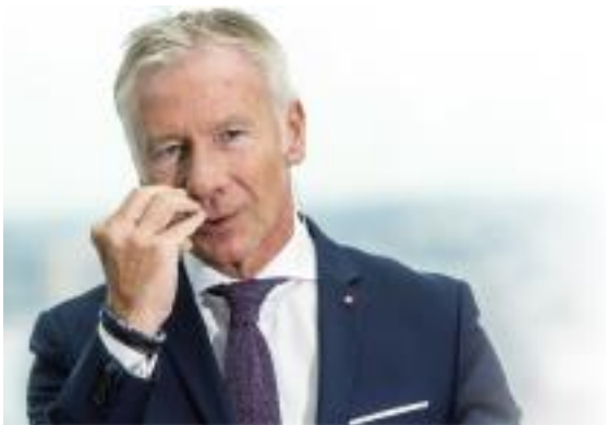
Marc Raisière CEO

Belfius veut être « meaningful » pour la société belge en proposant proactivement des solutions afin de relever les défis majeurs de demain. Belfius veut être « inspiring » en étant en permanence à la recherche de nouvelles solutions créatives et innovantes. A fortiori, cette crise est aussi l'occasion de concrétiser cette mission.