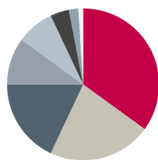
Distribution des investisseurs – nationalité

Germany / Austria - 35% Europe others - 22% Nordics - 18% BeNeLux - 10% France - 8% Asia - 4% UK&Ireland - 2% Switzerland - 1%