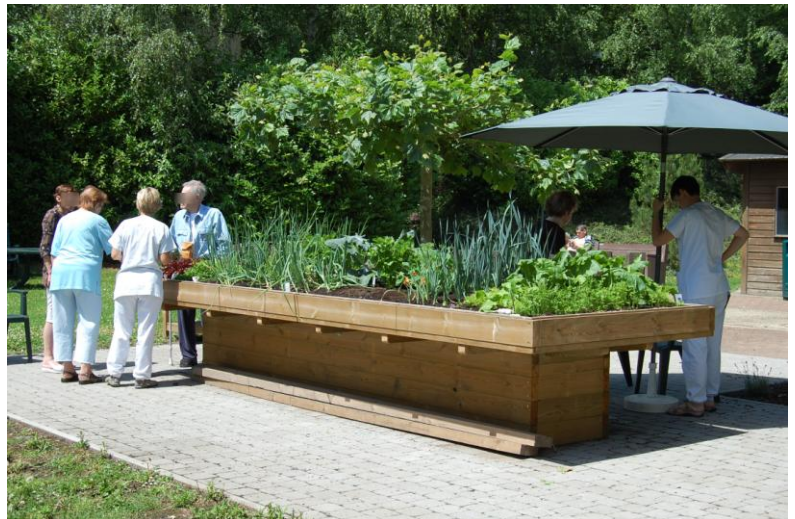
Une vue du jardin thérapeutique.

Les Cliniques de Soins Spécialisés Valdor-Pèrî inaugurent, sur le site Pèrî, un jardin thérapeutique. Les patients moins valides ou désorientés des services de Psycho-Gériatrie peuvent y déambuler, jardiner, échanger entre eux, avec les familles et les soignants. Primé par le concours « ColourYourHospital », ce projet a pu être concrétisé grâce à un don de Belfius Foundation.